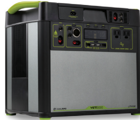
Batería portátil de reserva

Reciba gratis una batería de reserva con una fuente de energía limpia que le permitirá usar su dispositivo médico durante un corte de energía.